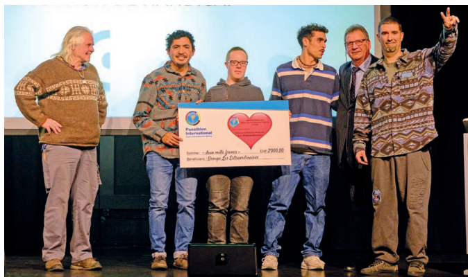
Le quatrième Coup de cœur 2023 du Panathlon d'Yverdon a été décerné aux Extra-ordinaires, basés à Chavornay, permettant aux personnes en situation de handicap de pratiquer l'escalade, grâce à des cours et des sorties.